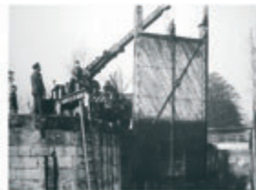
Demontage der Schleuse 99 durch das US-Militär, 1960