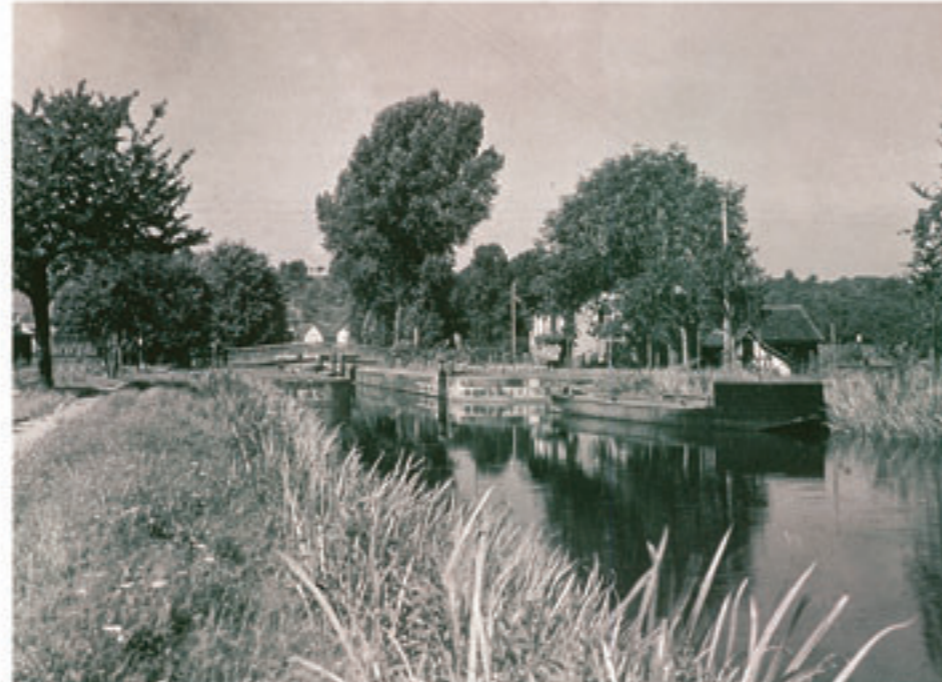
Historische Ansicht der noch intakten Schleuse 99