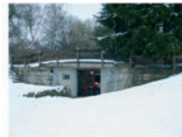
Die Schleusenammer wird heute als Abstellraum genutzt.

In Bughof kann man heute noch ein Relikt des Ludwig-Donau-Main-Kanals (1846-1950) finden, der einst auf 173 km Länge und mittels 100 Schleusen Main und Donau miteinander verband. Auf dem Gelände der Flussmeisterstelle sieht man das alte Schleusenwärterhäuschen und die 4,67 m breite und 34,15 m lange Schleusenammer. Diese ist heute durch eine nachträglich eingezogene Betondecke überbaut. Einige Meter weiter jenseits der Straße sieht man noch einen Rest des alten Kanalbetts.