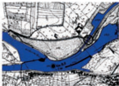
Lageplan der ehemaligen Schleuse 99 bei Bughof