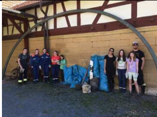
Auch bei der Jugendfeuerwehr in Wiesen waren fleißige Helfer im Einsatz.