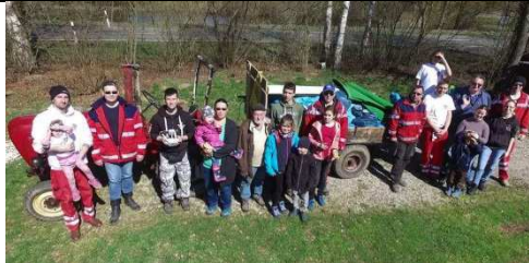
Erfolgreiche Sammelaktion bei der Wasserwacht Michelau zusammen mit Sea Sheperd.

Herzlichen Dank allen, die vor Ort mitgemacht, bei der Vorbereitung geholfen und sich um die Entsorgung gekümmert haben. Und ein besonderer Dank an die Abfallwirtschaftsverwaltung des Landkreises Bamberg und des Landkreises Lichtenfels für das Brotzeitgeld!