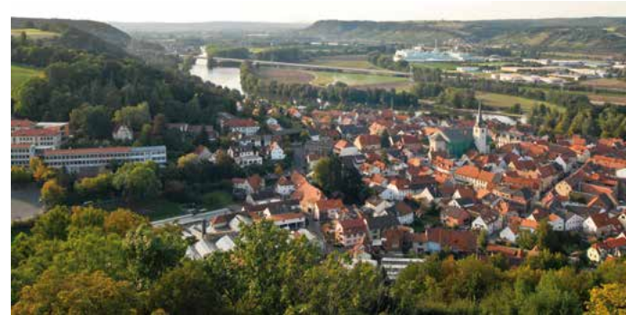
Blick von der Wallburg über den Maintal durchbruch bei Eitmann.

Flüsse geben der Landschaft ihren eigenen, unverwechselbaren Charakter. Sie sind die Lebensadern der Natur und zugleich kulturgeschichtliche Entwicklungsachsen. Durch Verkehrswege, Siedlungen, Industrie und Landwirtschaft hat der Mensch die natürliche Flusslandschaft stark verändert. Mit dem Flussparadies Franken wollen die Kommunen das Main- und Regnitztal für einen sanften Tourismus entwickeln und ökologisch aufwerten.