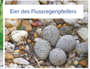
Eier des Flussregenpfeifers