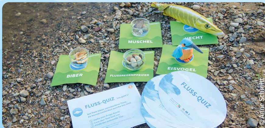
So sieht das Fluss-Quiz aufgebaut aus.